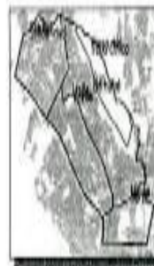
DISTRITO SAN BERNABE