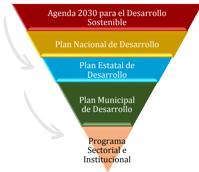
Figura no. 1 Alineación Municipal, Estatal, Nacional e Internacional de los Programas Sectoriales e Institucionales

La alineación deberá estar estructurada de la siguiente manera: